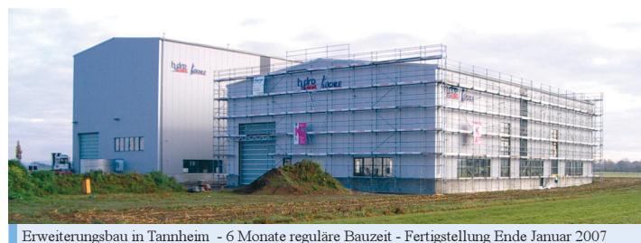
Erweiterungsbau in Tannheim - 6 Monate reguläre Bauzeit - Fertigstellung Ende Januar 2007

Die zusätzlichen 1.000 m 2 Fertigungsfläche sind insbesondere für die Vorfertigung der Behälterdächer vorgesehen. Durch eine Plasmaschneideanlage mit Abwickel- und Richtanlage soll in