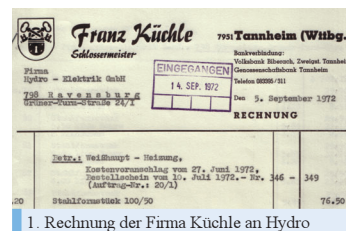
1. Rechnung der Firma Kühle an Hydro

Mitte 1972 wurden die ersten Aufträge abgewickelt und der Grundstein für eine bis jetzt andauernde, fruchtbare Zusammenarbeit - ohne schriftlichen Vertrag - gelegt.