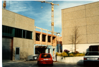
1988 Bau Bürogebäude

Fortsetzung von Seite 1 rung machten den Bau einer Lagerhalle am Firmensitz erforderlich. Ende 1986 wurden 3 Arbeitsplätze mit CAD ausgestattet. Nachdem die Mitarbeiterzahl bereits auf mehr als 30 angestiegen war und im Büro drängende Enge herrschte, wurde 1988 mit dem Bau eines Bürogebäudes die Basis für die nächsten 20 Jahre gelegt.