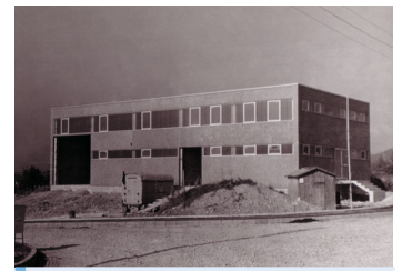
1973 Firmengebäude in Oberseschach im Bau