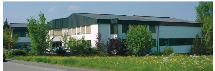
Hauptsitz der Firmengruppe Hydro-Elektrik GmbH in Oberschach

Am Anfang war es nur ein schneller Gedanke, um einem Kunden zu helfen. Am Ende führte diese Idee