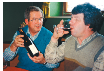
Firmengründer nach der Arbeit